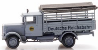
316.094 Hansa Lloyd Merkur